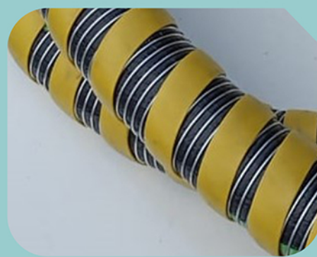
Revestimento Externo de Proteção