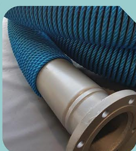
Revestimento Externo de Proteção