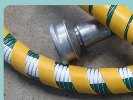
Revestimento Externo de Proteção